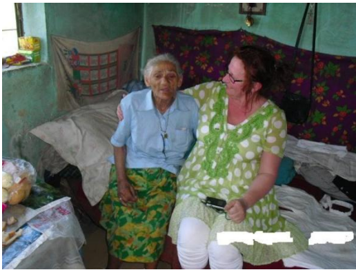
Oma Station en Dineke