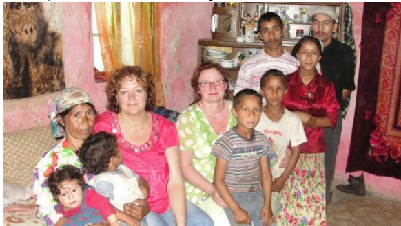
Călimănești gezin met 8 kids krijgen nw huisje