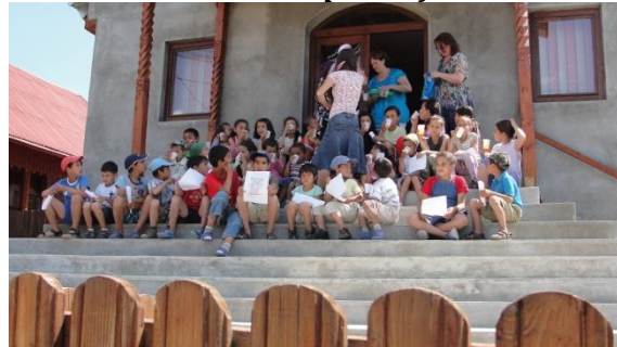
Prachtige dag in Eremitu