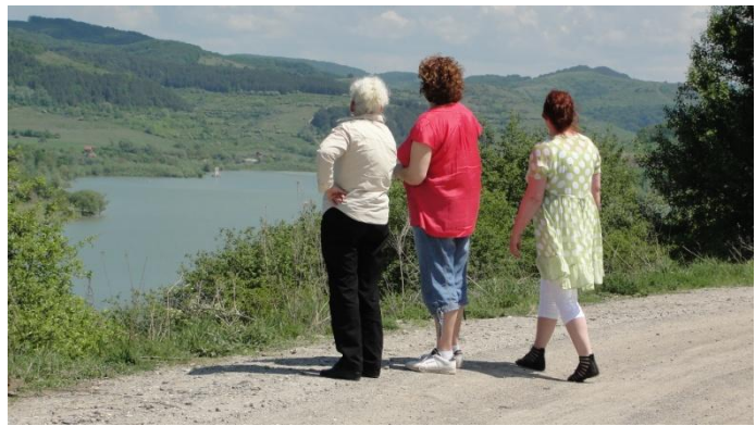
Lacul Bezid een paradijs