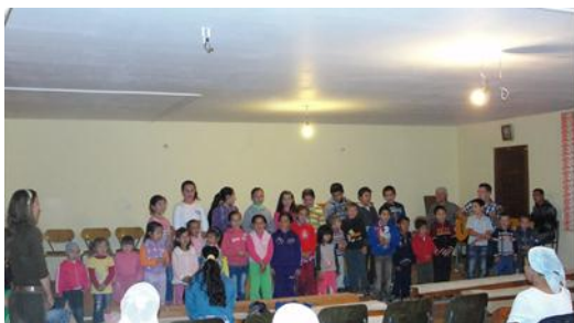
Kerkdienst Eremitu 25 oktober 2012