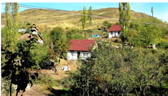
Nieuw dorpsaanzicht in Călimănești

September stond bijna geheel in het teken van de afwerking van de nieuwbouwhuisjes in Călimănești. Op dit moment weet je niet wat je ziet als je bij de huisjes komt en al helemaal niet als je er binnen stapt. Het dorp heeft een complete facelift ondergaan door de speciale ligging van deze blikvangers.