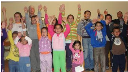
Kerkdienst Eremitu 25 oktober 2012

Afgelopen donderdag waren we in de kerk van Eremitu. Als ik zie wat daar allemaal tot stand is gekomen door de hulp van De Fontein en de Jongerengroep Splash, ja, dan kunnen we alleen maar stil en dankbaar zijn. Niet alleen voor het materiële, wat ooit zal vergaan, maar bovenal het eeuwige blijvende. We hopen daar nog een paar keer naar toe te gaan in de laatste 2 maanden. In onze allerlaatste Nieuwsbrief van dec. as. hoop ik wat in details over dit werk een terugblik te geven. Anders doe ik dat nog wel eens bij gelegenheid. (Of zou het tijd zijn om eens een boek te schrijven?) Mooi was dat ik nog namens SPLASH een prachtige complete geluidsinstallatie, die Splash hier in 2010 had achtergelaten, kon geven.